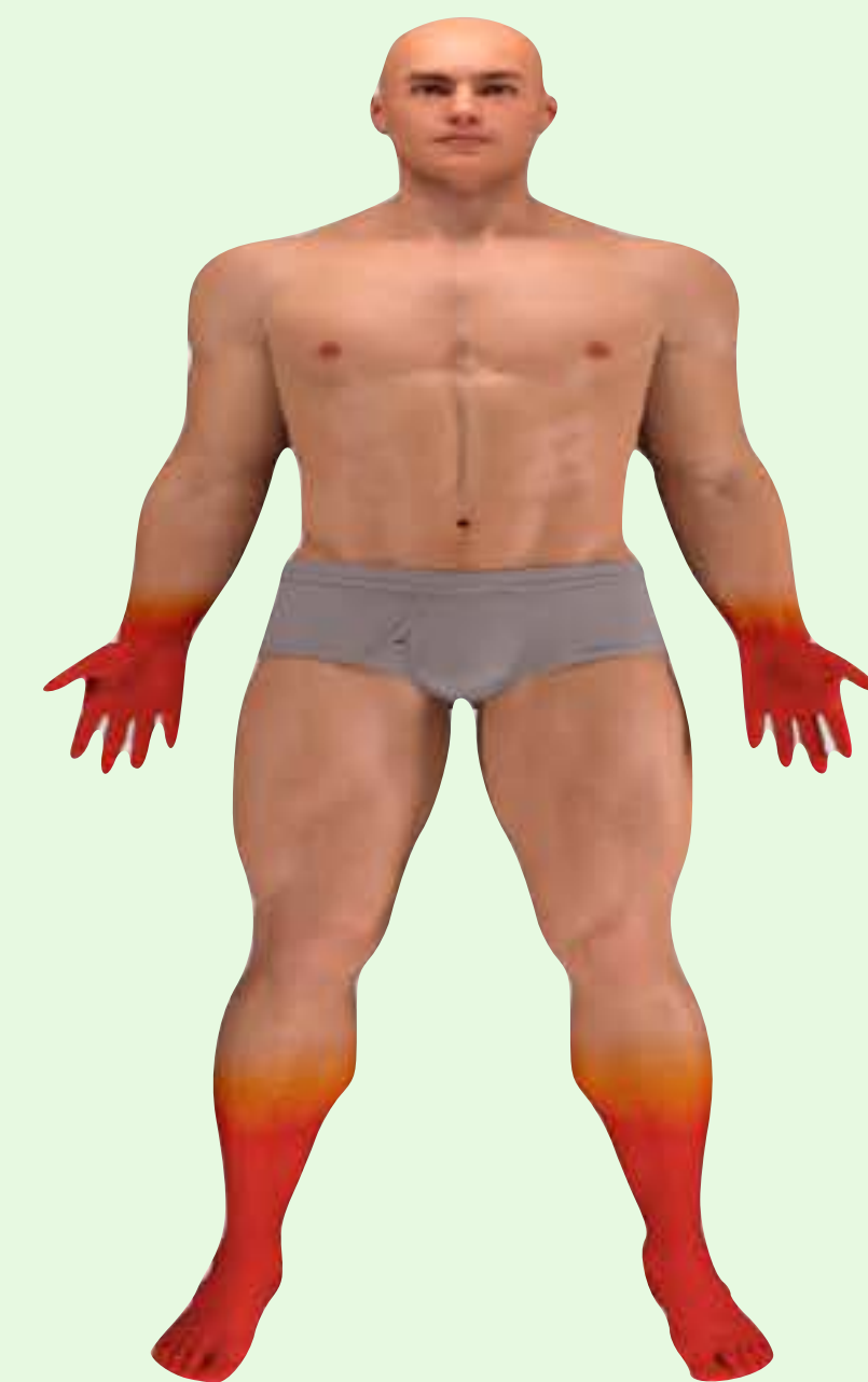
Sukka - hansikas - polyneuropatia