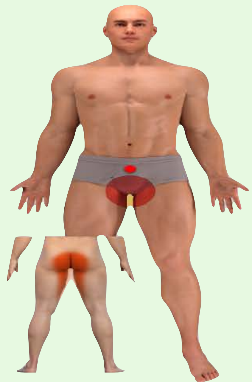
Ratsupaikka-anestesia ja cauda equina